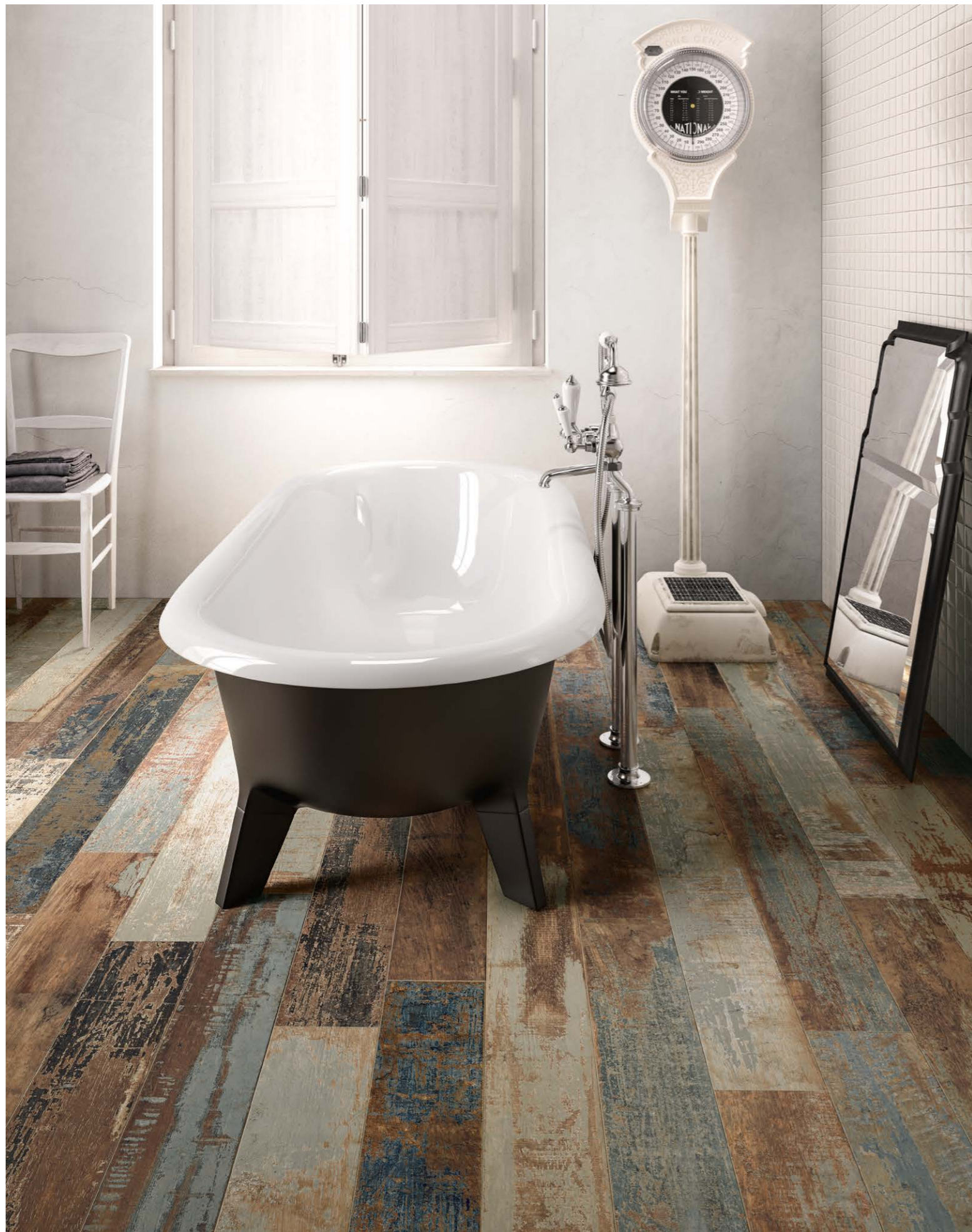
Colorart Navy 15120 Wall / Moda Bianco (ABITA Collection)