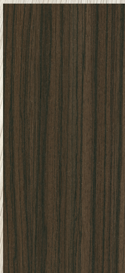
CBZ-02 Brun foncé