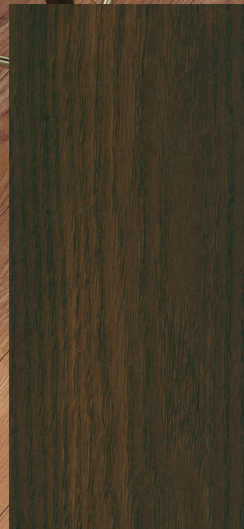
CCK-03 Brun foncé