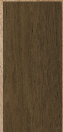
CEW-04 Brun foncé