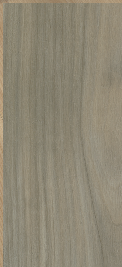
CNC-02 Gris pâle