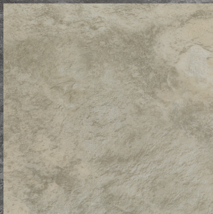
CRS-01 Gris pâle