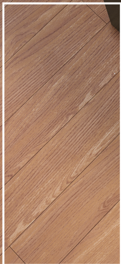
CCK-02 Brun doré