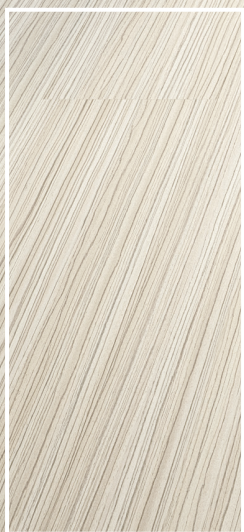
CBZ-01 Beige pâle