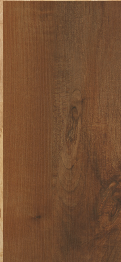
CCM-02 Brun rougâtre