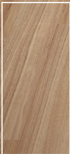
CEW-03 Brun pâle