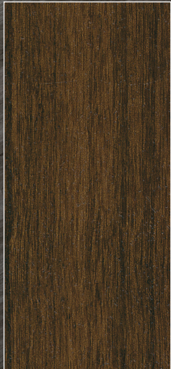
CSM-02 Brun foncé